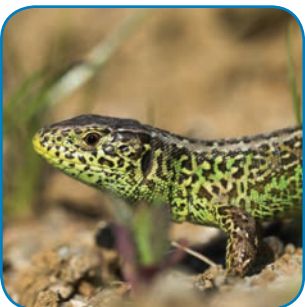
Markfirbenet lever på solrige sandede skrænter få steder i kommunen.