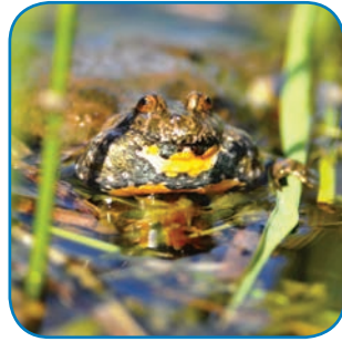
Klokkefrøen findes på Østfyn og øerne i Øhavet. Dens kvækken lyder, som når man blæser i en hul flaske.