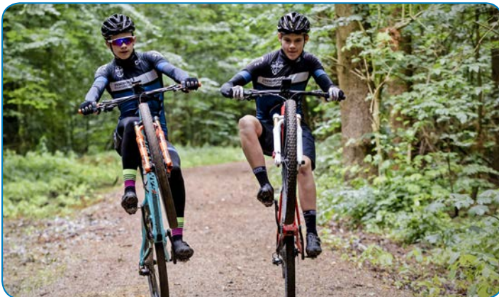
Venskaber opstår gennem et aktivt udliv.