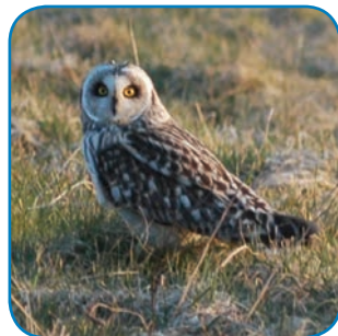
Mosehornuglen både yngler og overvintrer på øerne i Øhavet.