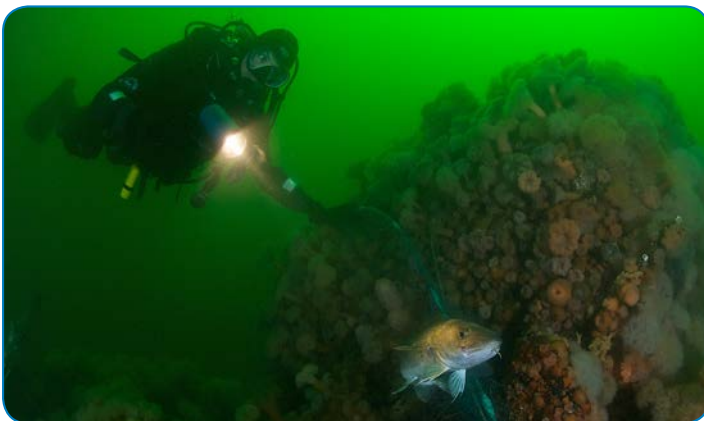
Dykker ved vrug.