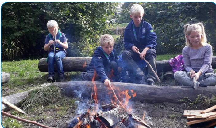
Christiansmindespejdernes minier laver mad over bål efter en lang gåtur i Vejstrup Ådal.