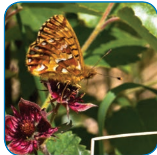
Moseperlemorsommerfugl er sjælden, men lever i Skovholm og Ravnebjerg moser.