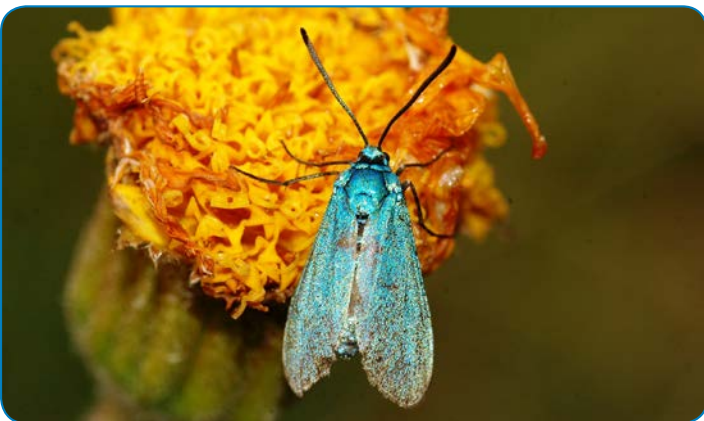
Metalvinge på guldblomme kan studeres i Rødme Svinehaver.