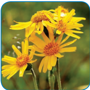
Guldblomme vokser i Rødme Svinehaver som det eneste sted i Østdanmark.