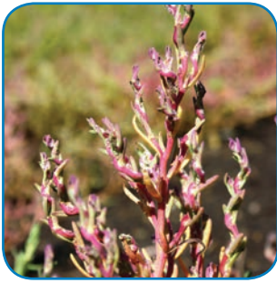
Tangurt farver strandengene røde om efteråret. Den kan kendes på de snoede stængler.