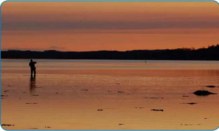
Lystfisker i solnedgangen.