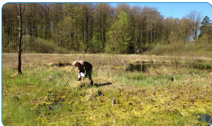
Skovholm Mose er en hængesæk, der er dannet af spagnummosser. Her lever flere af vores mest sjældne arter.