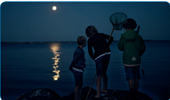
En sommernat i måneskin ved Elsehoved.